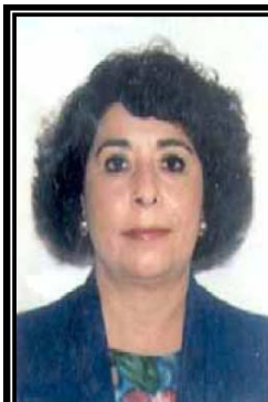
EMBAJADORA DE MÉXICO EN COSTA RICA