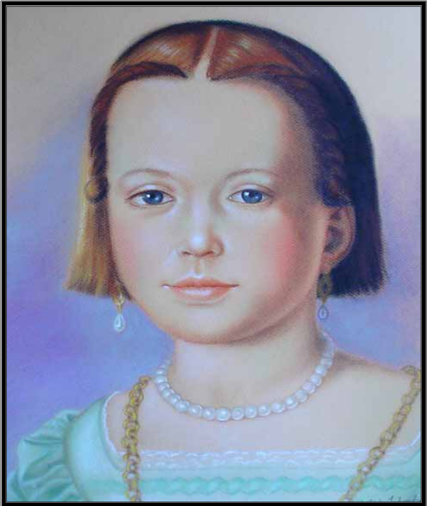
JADWIGA (Fragmento de una obra de Agnolo Bronzino)