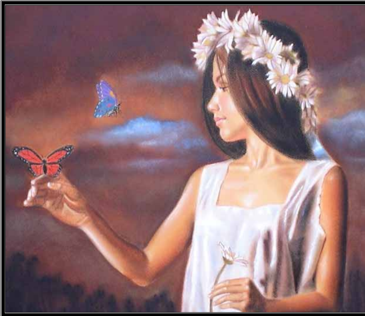
ODA A ROCÍO (Tomada de la obra de Whitaker)