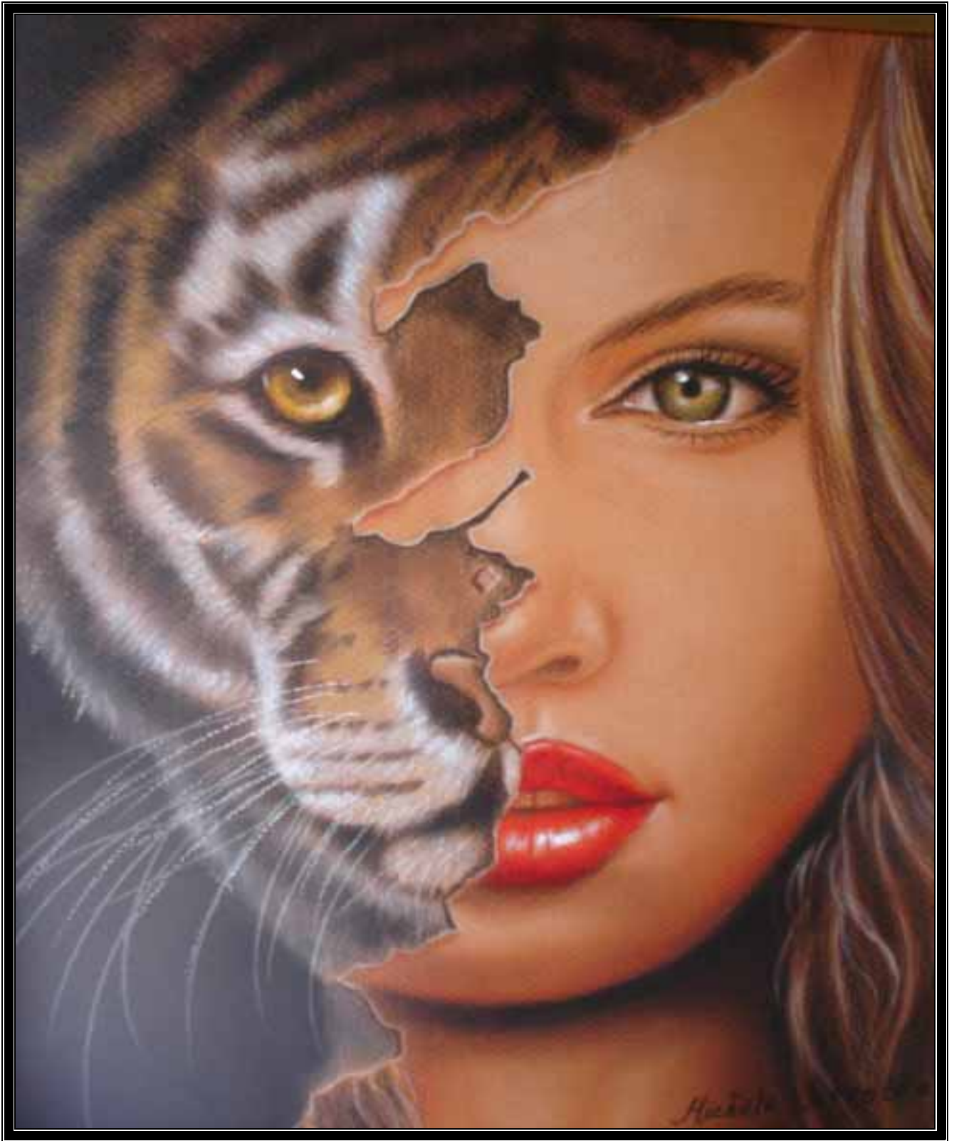
ANGELINA (Tomado de la obra de Jim Warren)