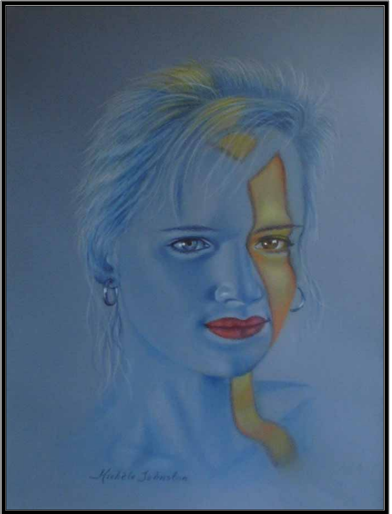
JULIETTE (Tomado de la obra de Jim Warren)