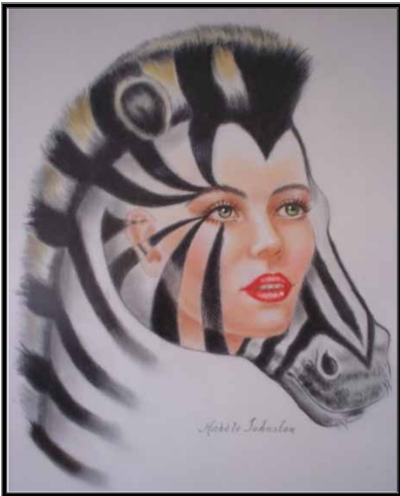
ÁFRICA MÍA (Tomada de la obra de Claudio Tessari)