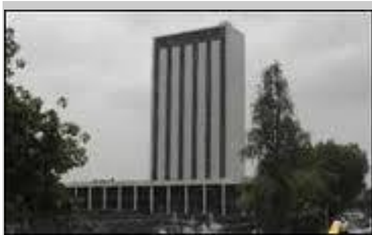
Torre de Tlatelolco, antigua sede de la SRE

México, D. F. Martes, 14 de febrero de 2012