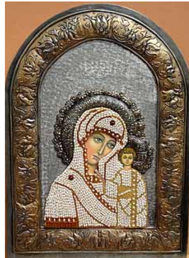
Virgen de Kazán