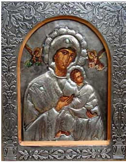
Virgen de la Pasión