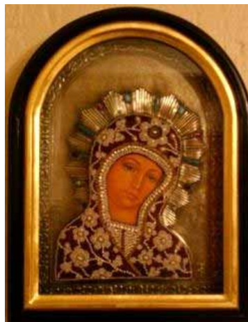
La Madre de Dios*

*Luego de que Miguel Ángel terminara la escultura de La Piedad, le preguntaron por qué María estaba representada tan joven, a lo que él respondió: “Porque el amor de una madre nunca envejece”.