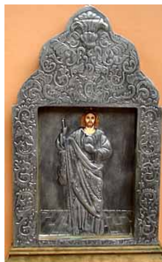
San Judas Tadeo