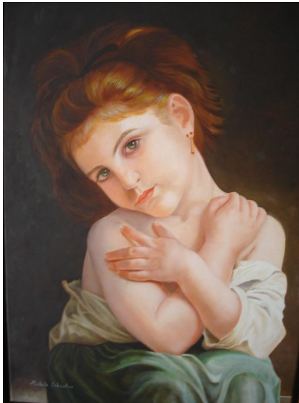
La Friolenta (Reproducción de la obra de Bouguereau)

Adolphe-William Bouguereau fue uno de los pintores más queridos para el tiempo de su muerte en 1905. Por fin los críticos de arte, se dieron cuenta que los oficiales en el mundo del arte francés, estaban equivocados y que los trabajos de Bouguereau estaban entre los favoritos de los coleccionistas, que encontraron en sus pinturas de bañistas, ninfas y campesinas la eterna belleza de la vida contemporánea. 1