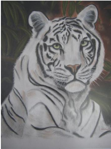
Fernando Martín Nava Tomado de la obra de Gabriel Hermida