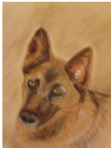
Pintado por Loli Curiel de González