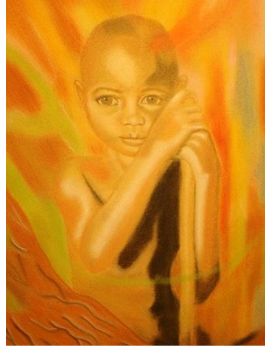
Evelyn de Andión Tomado de la obra de Pedro Sanz