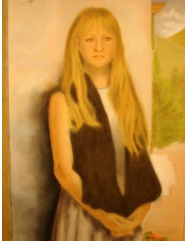
Judy – de Fernando Martín Nava Adaptación de una obra de Allan Banks