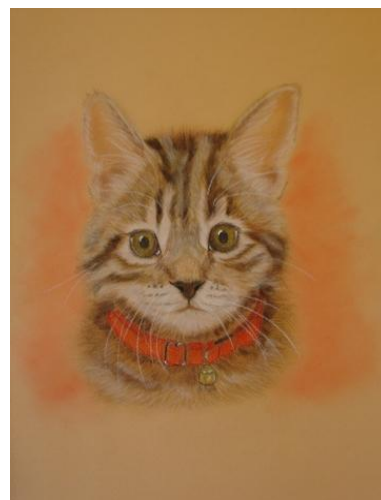
Pintado por Loli Curiel de González