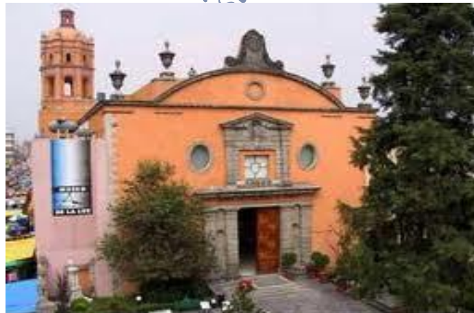
Templo de San Pedro y San Pablo

Dicha decisión causó malestar entre los partidarios de la creación de una república, entre ellos Vicente Guerrero y Guadalupe Victoria. En diciembre de 1822, Antonio López de Santa Anna –hasta entonces soldado al servicio de la corona española- proclamó el Plan de Veracruz, provocando que antiguos insurgentes de ideas republicanas, se levantaran en armas. Acto seguido, en febrero de 1823, se firmó el llamado Plan de Casa Mata, por el cual se unieron realistas y republicanos para luchar por el derrocamiento de Iturbide. La aventura imperial –que dicho sea de paso, logró el ensanchamiento del territorio mexicano, al conseguir que la mayor parte de Centroamérica se uniera al imperio-, terminó el 19 de marzo de 1823, cuando Iturbide tuvo que renunciar y partir al exilio.